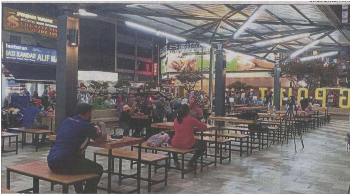
Visitors to Laman Santai Ampang Point can buy food and beverages from nearby food trucks and eat at the communal space provided.

Provided for client's internal research purposes only. May not be further copied, distributed, sold or published in any form without the prior consent of the copyright owner.