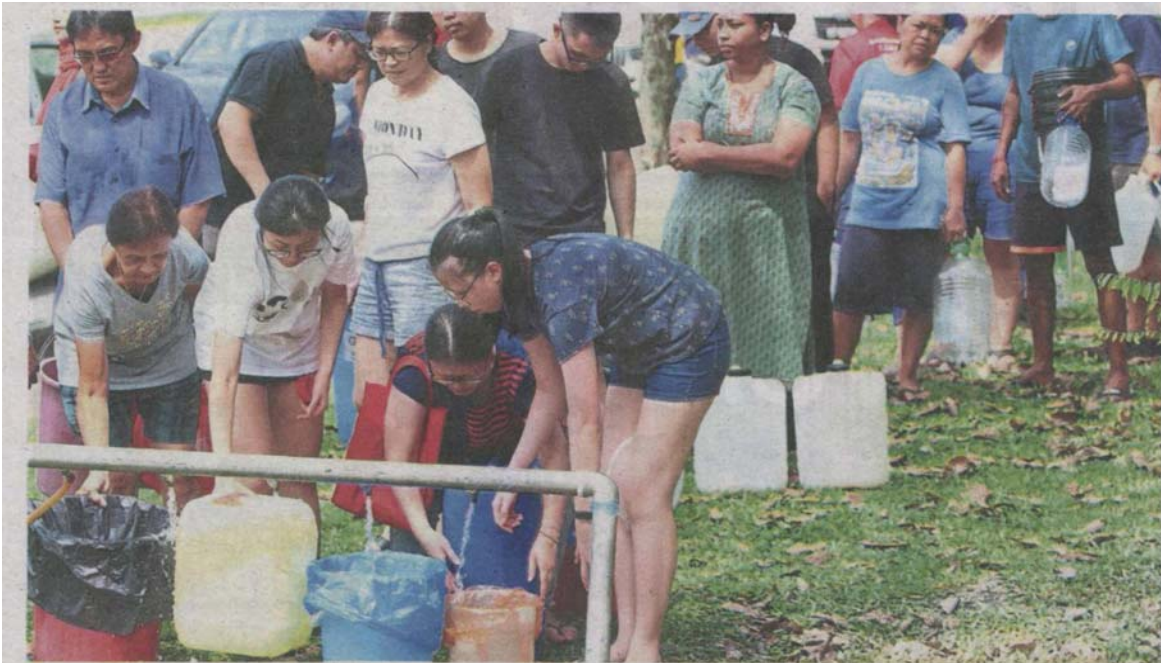
Recurring problem: Residents of USJ 4 Subang Jaya collecting water from Syabas' static water pipe at USJ 3A/1.

Provided for client's internal research purposes only. May not be further copied, distributed, sold or published in any form without the prior consent of the copyright owner.