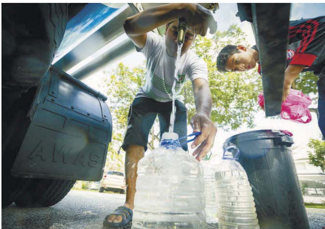
Residents in Subang Jaya collecting water from a tanker during the treatment plant shutdown.

"This area is near the Negri Sembilan border and an industrial area, we cannot stop them from entering this place," he said.