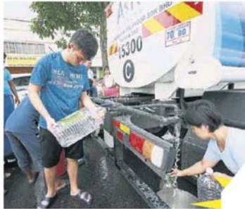
■斷水適逢冬至，沙登民眾飽受斷水之苦，無法与家人安心過冬，反要到處打水，為水煩惱而大吐苦水。

“土毛月濾水站多次發生人為污染，被迫關閉而引發斷水，政府理應從中吸取經驗，加強人力監督河流周遭的環境，避免再次發生同樣事件，啟動大規模的斷水而苦了人民！”