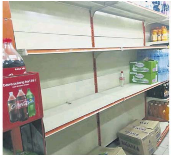
矿泉水在一夜之间被一扫而空。

今早，该区持续面临制水情况，根据雪州水供公司文告指出，土毛月河污染是此次制水主因，而