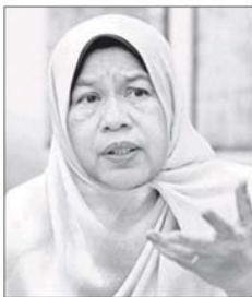
祖莱达 ▣ 房地部长