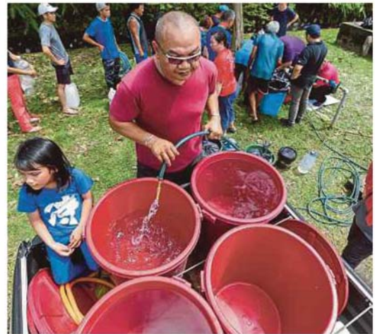
Penduduk mengisi air dalam bekas simpanan air dari paip awam di Subang Jaya, semalam.