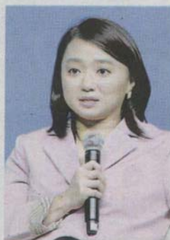
Yeoh says a children's agency is also in the pipeline next year to outline plans specially catered to children's needs

Yeoh added that a children's agency is also in the pipeline next year to outline plans specially catered to children's needs.