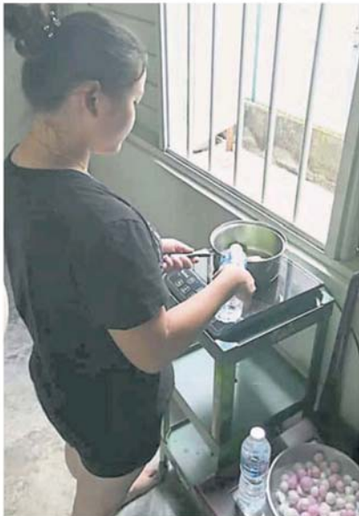
村民目前只能节省用水，使用矿泉水煮汤圆。