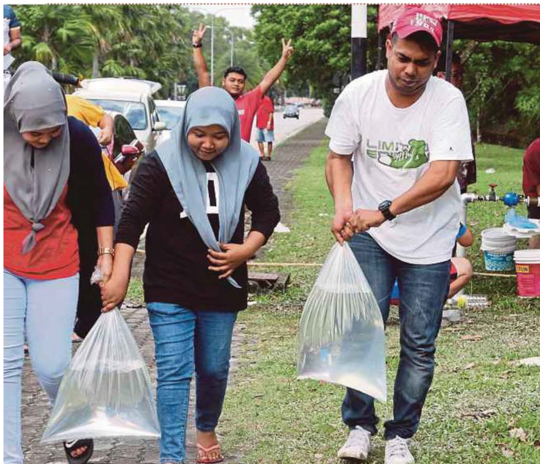
USJ 12 residents getting their water supply at the main pipe in USJ 3A, Subang Jaya, yesterday.