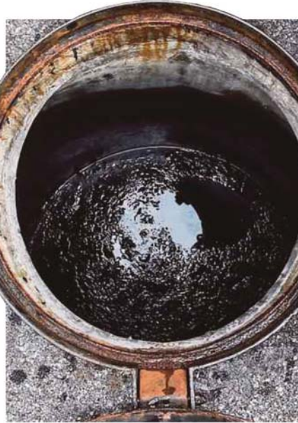
MINYAK kehitaman dalam sistem pembetungan IWK mengakibatkan arahan henti tugas di dua Loji Rawatan Air Sungai Semenyih dan Bukit Tampoi.